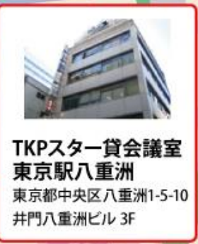
TKPスター貸会議室 東京駅八重洲 東京都中央区八重洲1-5-10 井門八重洲ビル 3F